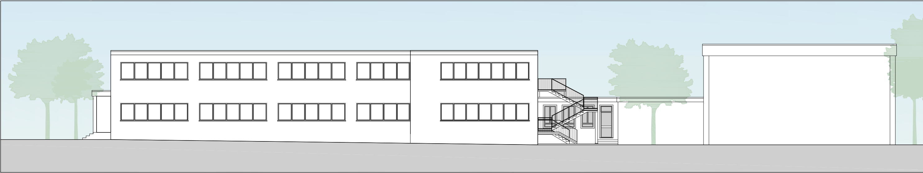
Prospetto sud-ovest - Scala 1:200