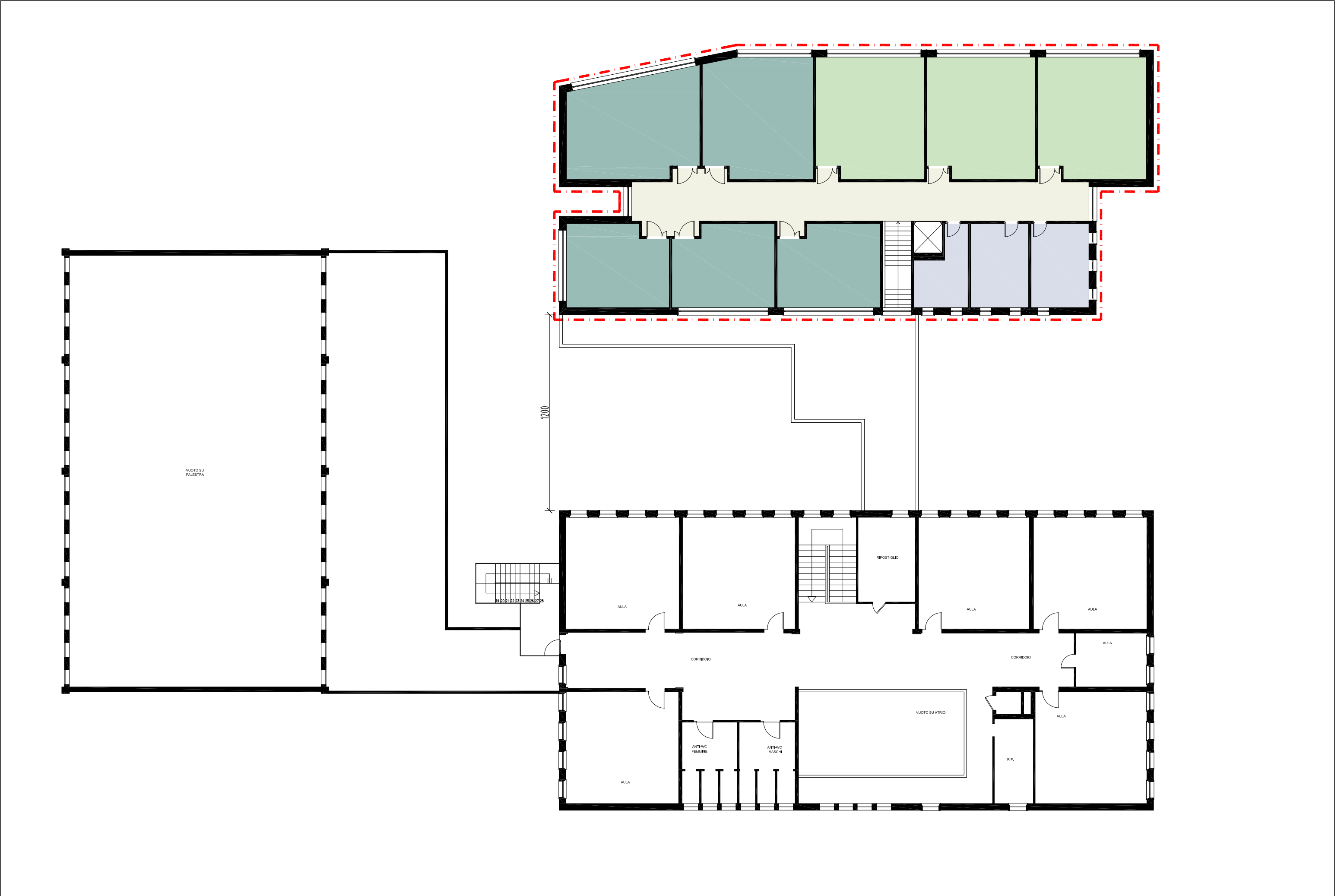
Pianta piano primo Scala 1:200