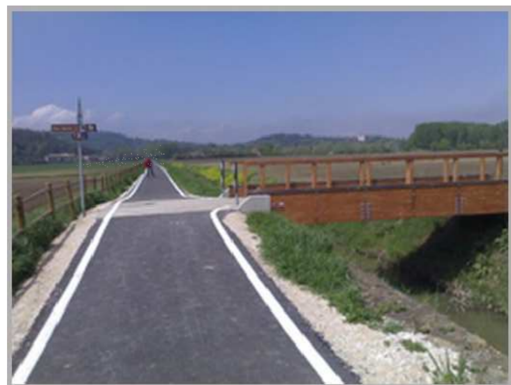
ANELLO DEI COLLI EUGANEI Tipologico pista su sommità arginale: sede ciclabile in binder chiuso con doppia linea continua